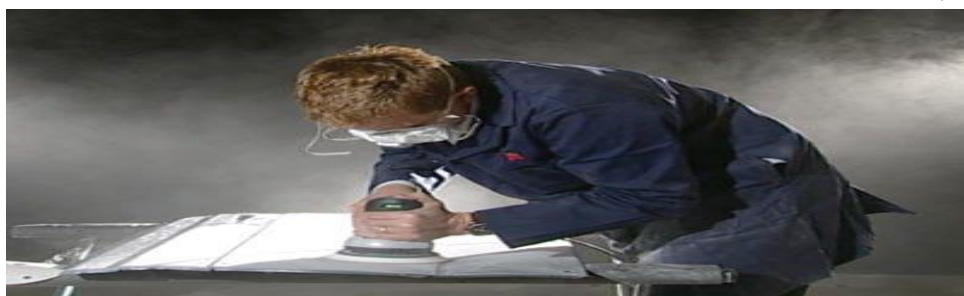
شکل ۱- استفاده از وسایل حفاظت فردی

استفاده از وسایل حفاظت فردی: کارگر باید از وسایل حفاظت فردی مناسب، مانند نقاب صورت (ماسک جوشکاری)، عینک مخصوص، دستکش جوشکاری و پیشبند چرمی در هنگام جوشکاری استفاده نماید. معمولاً استفاده از لباس فلانل بر نوع چرم آن برتری دارد.